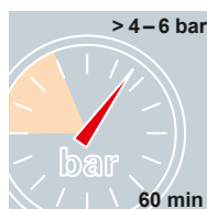
Wasser DIN 18380