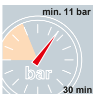
Wasser DIN EN 806-4